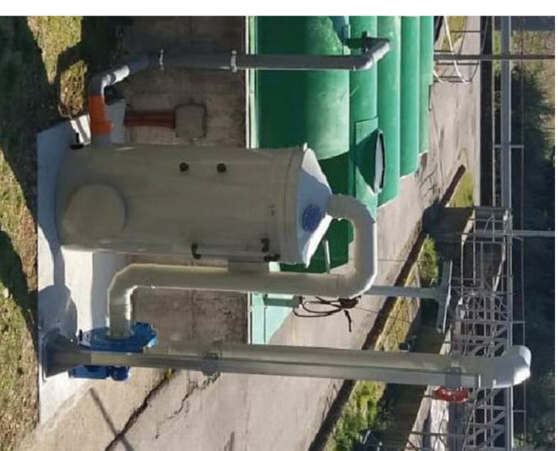
DK FIL 1500 SYSTEM